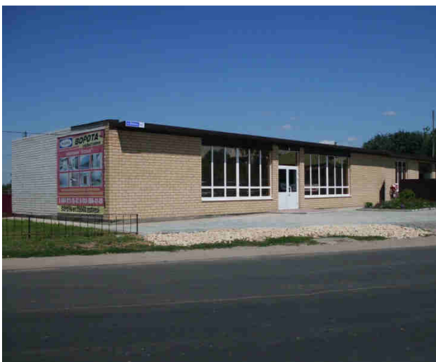
ИП Дей С.А.