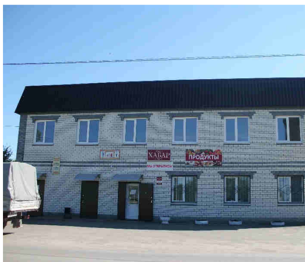
ИП Ханыгов А.Б.

Всего было реализовано 14 мероприятий. Дополнительно получено 11,2 млн.руб. отчислений в бюджетную систему. Сельское хозяйство