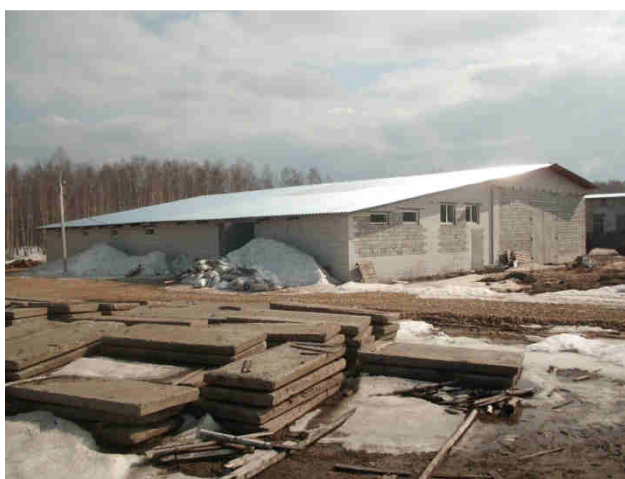
ИП Мялкин А.В.