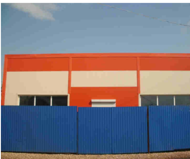
ИП Сорокин М.В.