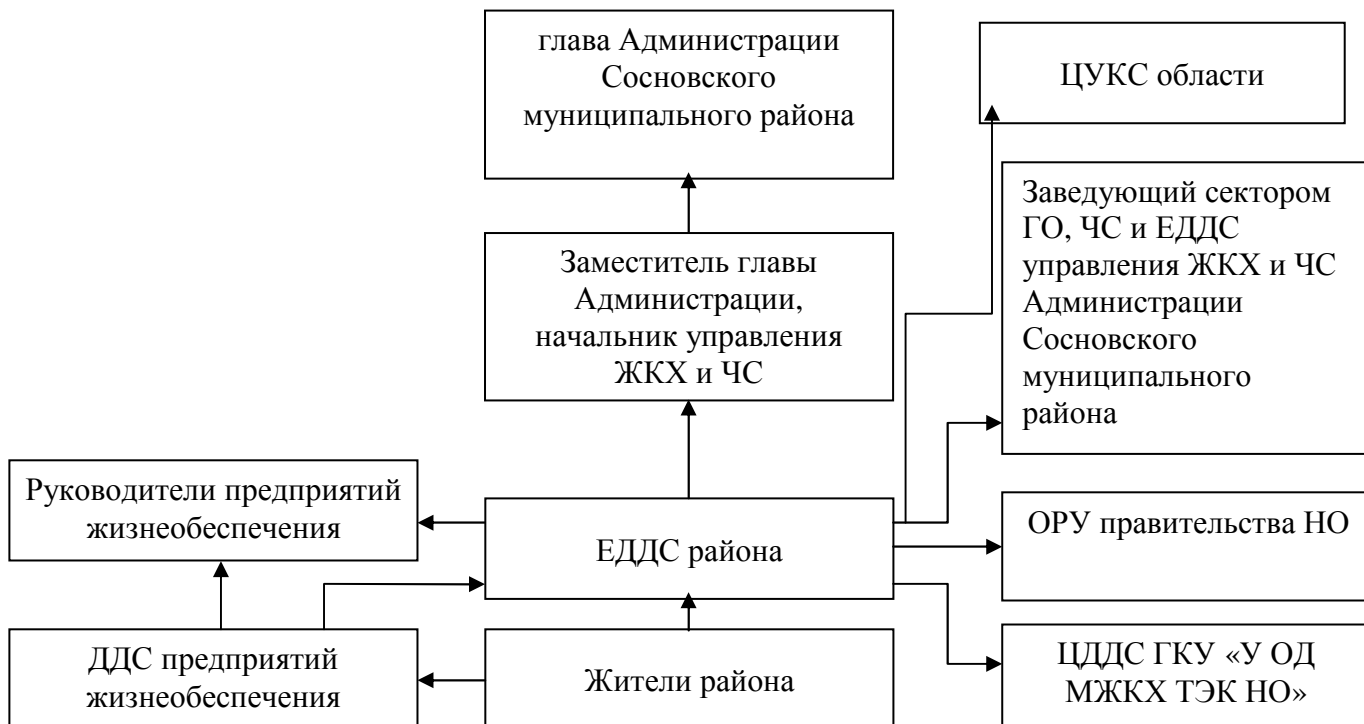
Схема оповещения ответственных лиц при авариях и ограничениях на объектах жизнеобеспечения Сосновского муниципального района Нижегородской области

Утверждено постановлением Администрации Сосновского муниципального района Нижегородской области от 19.12.2016 № 305