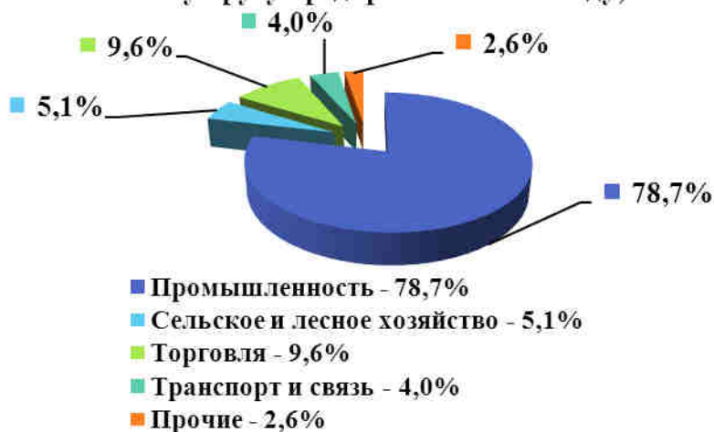
Структура экономики Сосновского муниципального района по полному кругу предприятий в 2011 году, %

Отгрузка товаров собственного производства за 2011 год по полному кругу организаций составила 1487,7 млн. руб. (по крупным и средним организациям - 1116,3 млн. руб.), удельный вес отгруженной продукции в общем объеме отгрузки по области – 0,12%.