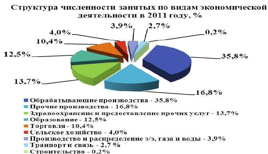
Диаграмма распределения занятых по отраслям экономики за 2011 год по Сосновскому району.

В 2011 году в экономике района было занято 7,23 тыс. чел. При этом основная доля занятых приходится на промышленность, в частности, на обрабатывающие производства - около 36% населения.